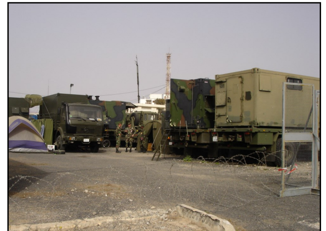
2005 NATO DEPLOYABLE COMMUNICATIONS MODULE

TAMΣ NATO NOBLE JAVELIN - 2005 ΚΑΝΑΡΙΑ ΝΗΣΙΑ