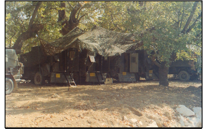
1995 ΚΕΠΙΚ ΕΝ ΕΚΣΤΡΑΤΕΙΑ